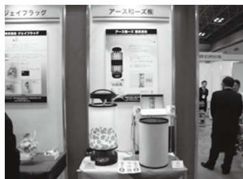
▲アース和ース株式会社 (http://www.wakaden.co.jp/)

アース和ース株式会社は、千代田ビジネス起業塾の卒業生によるベンチャー企業で、日本の文化・美・である「和」を取り入れた「和家電」という新しい製品を生み出しました。今回は、「和」を取り入れた新しい扇風機「和風機」の実物展示を行いました。