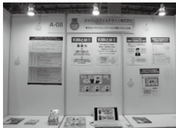
▲ジャパンスタイルデザイン株式会社 (http://www.japanstyledesign.com/)

今回は、異文化ビジネスコミュニティ「KIBI」を展示し、多くの商談が入っていました。