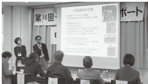
▲海老原商店を活かす会のメンバー

7月の公開審査会で助成決定を受けた「はじめて部門」「一般部門」「テーマ部門」の12グループが、これまでの活動内容を報告し、問題点や課題などに対して審査委員の適切なアドバイスや激励の言葉を受けました。