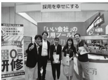
▲株式会社リブリッジ (http://www.rebridge.co.jp/)

今回は、「いい会社」の採用ツール「グーカ」や、介護職に特化した求人サイト「介護テラス」などを紹介し、多くの来場者がブースを訪れていました。